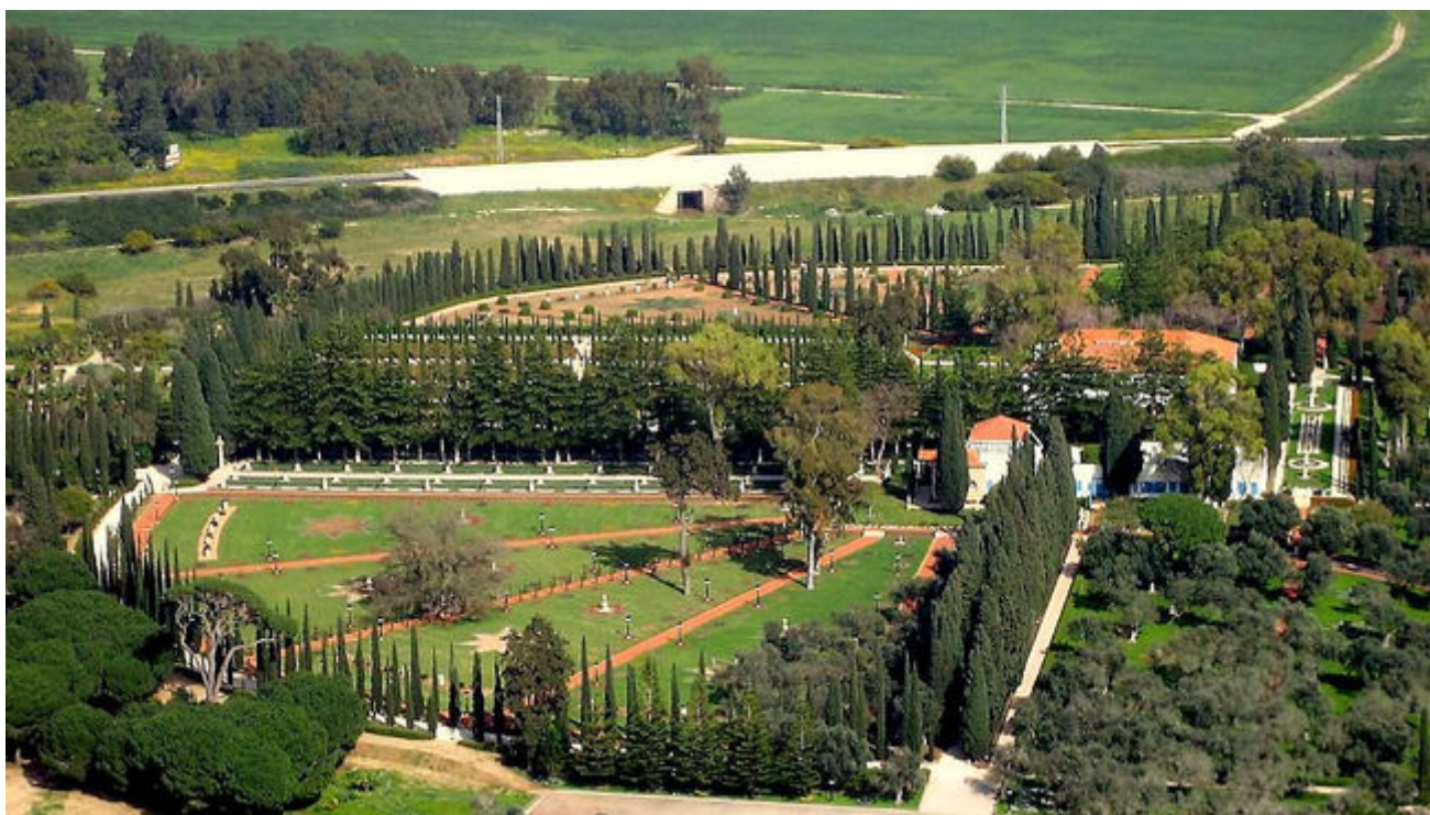
A la dreta, vista dels jardins i el complex a la badia de Haifa on hi ha l'última residència i el santuari de Bahà'u'llah, el fundador de la religió bahá'í, de qui el 2017 es va celebrar el bicentenari del naixement